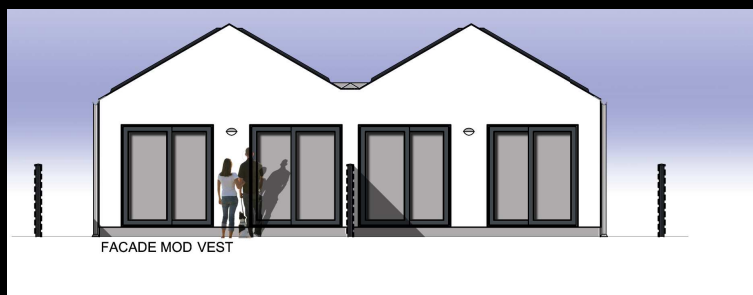
Gavlfacade mod haven [vest]