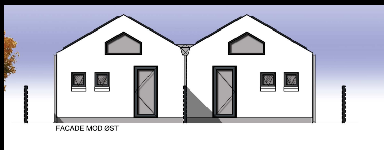
Gavlfacade mod P [øst]